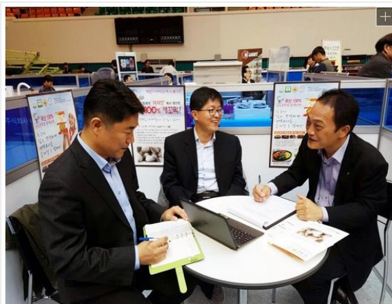
▲NS홈쇼핑 MD가 중소기업 무료 상담을 진행하고 있다

NS홈쇼핑은 '제2회 혁신센터 우수상품 공동 소싱박람회'에 참가해 중소기업 판로 개척 지원에 나선다고 24일 밝혔다.